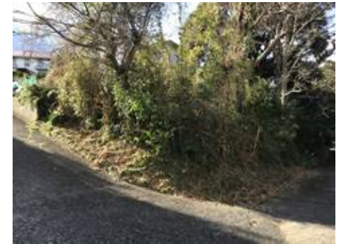
所在地: 静岡県下田市旧岡方村字笹峯