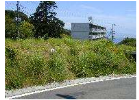
所在地: 静岡県熱海市下多賀