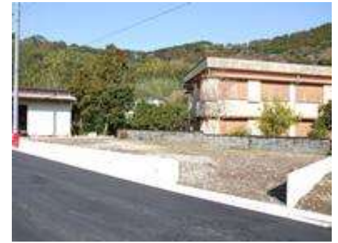
所在地: 静岡県賀茂郡東伊豆町片瀬