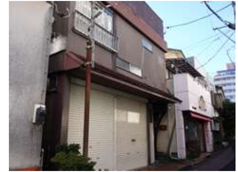
所在地: 静岡県伊東市猪戸