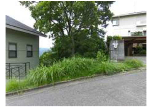
所在地: 静岡県田方郡函南町丹那