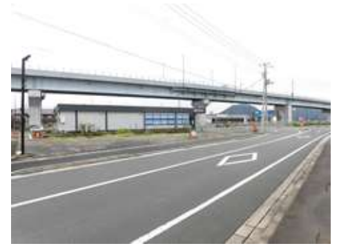
所在地: 静岡県田方郡函南町間宮