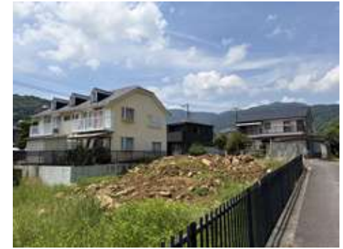
所在地: 神奈川県足柄下郡湯河原町中央

☆ インテリアショップから生まれたデザイン工務店による建築条件付き。憧れの新築住宅を建築しませんか？