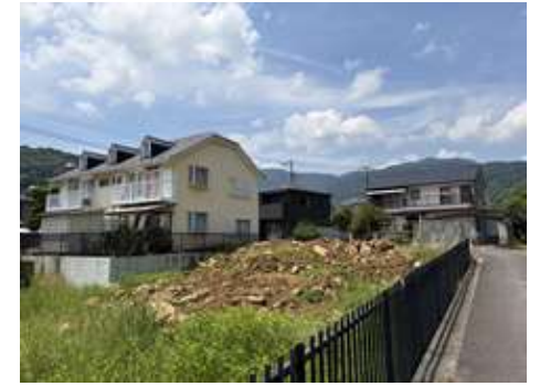
所在地: 神奈川県足柄下郡湯河原町中央

☆ インテリアショップから生まれたデザイン工務店による建築条件付き。憧れの新築住宅を建築しませんか？